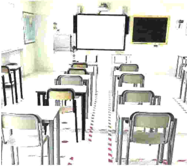
I PREPARATIVI Un'aula dell'istituto alberghiero: i banchi, oltre ad essere distanziati, saranno occupati «a scacchiera»